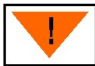
Nr 13 (RID) – Przetaczać ostrożnie.

c/ Oznakowanie jednostek transportowych tablicami ostrzegawczymi barwy pomarańczowej - wzory tablic: